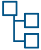
Parça ve Malzeme Listesi Yönetimi

İlk önceliğiniz, halihazırda sahip olduğunuz PLM işlevselliğini değiştirmek olabilir ve bu açıkça önemli bir hedeftir. Halihazırda elde ettiğiniz verimlilik ve kalite kazanımlarını geri vermek istemezsiniz. 3DEXPERIENCE platformunun kapsamlı PLM yetenekleri ve çok daha fazlasını sağladığından emin olabilirsiniz.