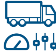
Tedarik Zinciri Yönetimi